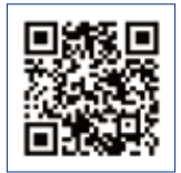
携帯バーコード QRコード対応の携帯電話を使うと、申込サイトにアクセスできます。

パソコンまたは携帯からURLにアクセスし、大会エントリーページの指示に従ってお申し込みください。支払方法はお選びいただけます。(クレジットカード、コンビニ、ATMなど) ※別途手数料がかかります。